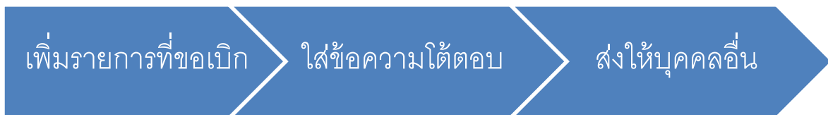
รูปที่ 3 ขั้นตอนการเพิ่มรายการที่ขอเบิก